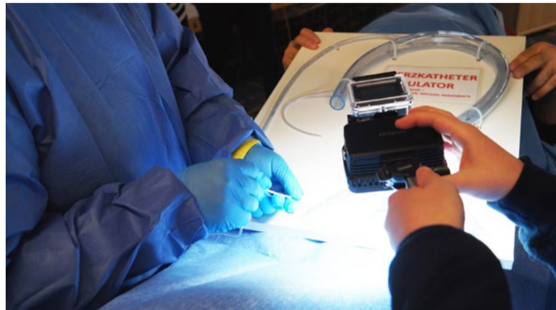
Hautnah dabei: Mit Unterstützung aus dem Publikum wird eine Herzkatheter-Untersuchung simuliert.